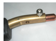
หัวไล้บวมแบบจุด