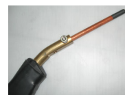
แท่งคาร์บอนไล้บวม