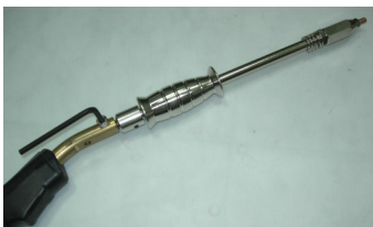
ตัวกระตุกตรง

ปรับ CURRENT + TIMER ไปที่รูปในตำตำแน่งรูปเดียวกัน โดยให้สัมพันธ์กับ FUNCTION ด้านบน