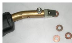
หัวเชื่อมแหวน